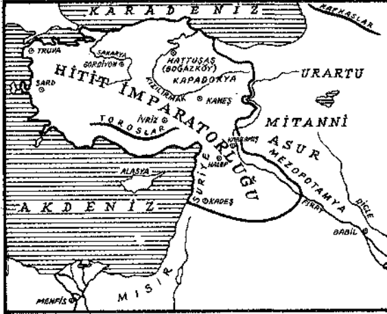
Yeni Krallık devrinde Hitit İmparatorluğunun sınırları ve komşuları