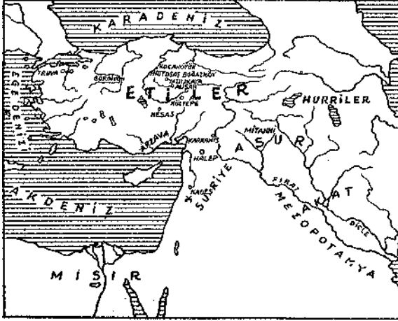
Anadoluda Eti İmparatorluğu