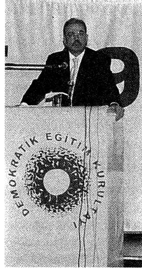
Rıdvan Budak DİSK Genel Başkanı