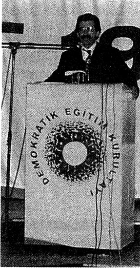
Siyami Erdem KESK Genel Başkanı

Değerli dostlar, bu duygularla Eğitim Sen'in düzenlediği Demokratik Eğitim Kurultayı'nın Türkiye'ye ve tüm dünyaya, eğitime bakışta yeni bir ivme katacağına inanıp hepinize çalışmalarınızda başarılar dilerim. Teşekkür ederim.