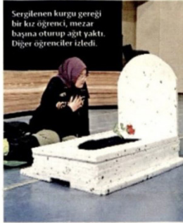
Sergilenen kurgu gereği bir kız öğrenci, mezar başına oturup ağıt yaktı. Diğer öğrenciler izledi.