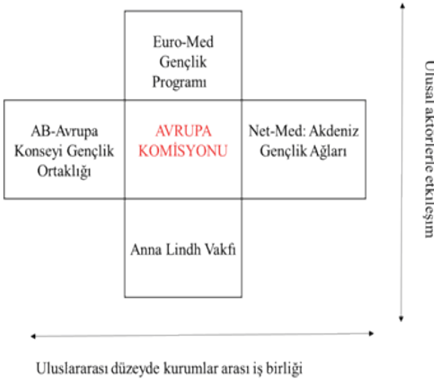
Şekil 2: Uygulama ağlarının niteliği

Dört gençlik iş birliği şemasına ait ara değerlendirme ve sonuç raporlarından ve alan araştırmasında gerçekleştirilen görüşmelerden elde edilen veriler ışığında, Tablo 2'de de gösterildiği üzere, şemaların uygulama ağlarında yer alan aktörlerinin niteliği açısından iki eğilim ortaya çıkmaktadır: (i) Ulusal aktörlerle etkileşimi yüksek gençlik iş birliği şemaları (Euro-Med Gençlik ve ALF); ve (ii) uluslararası düzeyde kuruluşlar arası iş birliğine bağlı olanlar (Gençlik Ortaklığı ve Net-Med Gençlik) (Şekil 2). Bu durum haritalanan aktörler arasındaki ilişkileri “açıklayıcı değişken” olarak değerlendirirken (Kapucu ve Hu, 2020: 29) başvurulabilecek ve politika uygulama sürecini kolaylaştırma veya engelleme potansiyeline sahip iki aracı değişkene işaret etmektedir: uygulamada ulusal aktörlerle etkileşim ve ulusal aktörlerin rolü; ve, uygulama ağları içerisinde ve şemalar arası koordinasyon ve iş birliği düzeyi.