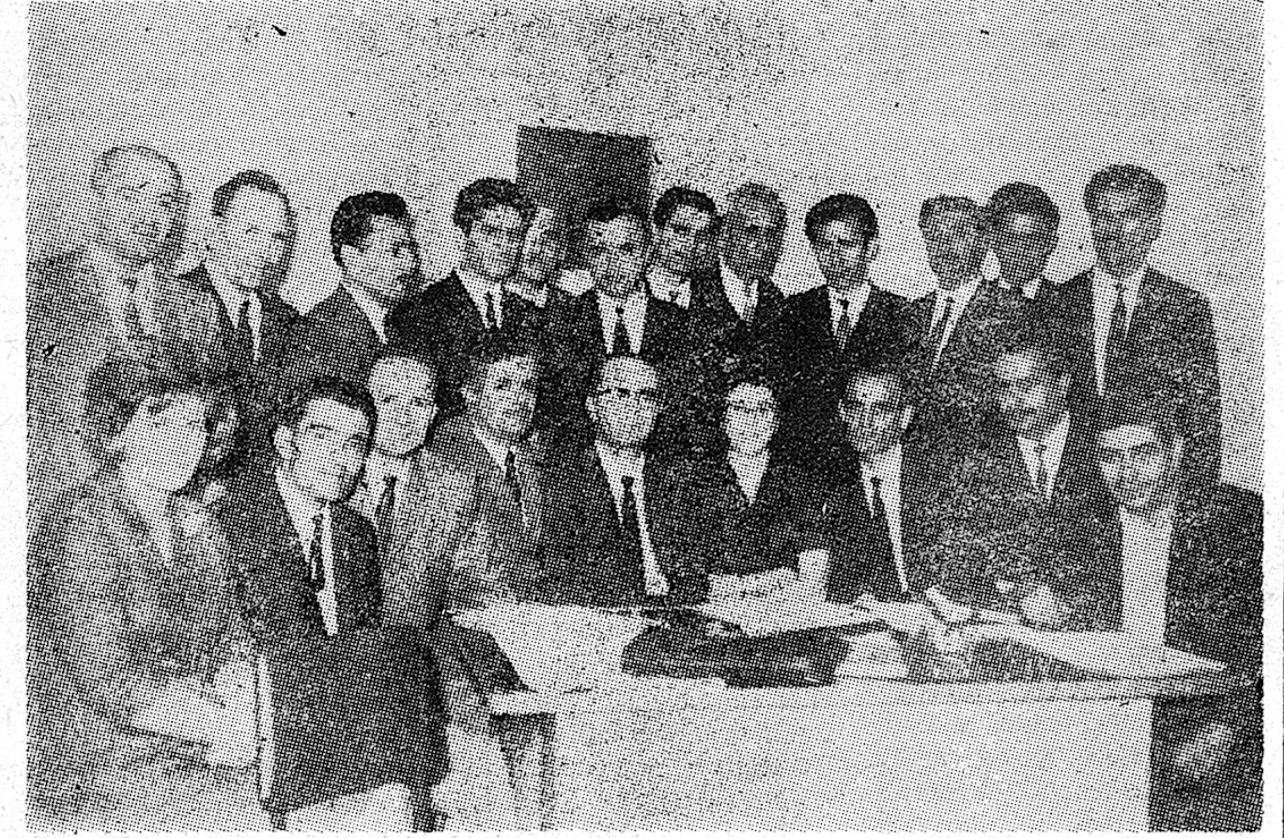
Yönetim Kurulu son toplantısını 5 Temmuz'da Giresun'da yapacak.

Türkiye Öğretmen Dernekleri Millî Federasyonu'nun 20. Kurultayı bu yıl 6/8 Temmuz 1967 günlerinde Giresun'da yapılacaktır. Bir yıldır başarı ile çalışmalarını yürüten TÖDMF. Yönetim Kurulu, Kurultaya sunulacak Çalışma Raporunu hazırlamış ve geçtiğimiz hafta, bağlı derneklere göndermiş bulunmaktadır. Federasyon Bürosu 15 gündür yoğun bir şekilde çalışmaktadır. Bağlı derneklerin Kurultaya gönderecekleri delegelere ait belgeler Federasyona gelmektedir. Gelen belgelere göre, Kurultay tanıtma kartları da hazırlanmakta olup, dernek temsilcilerine Giresun'da verilecektir. Aynı zamanda UNESCO de legesi olan TÖDMF. Yürütme Kurulu üyeleri, UNESCO'nun 29 Haziran'da İstanbul'da başlıyan Genel Kurul toplantısına katılmak üzere hareket etmişlerdir. Yürütme Kurulu üyeleri 3 gün sürecek Genel Kurul toplantısından sonra Ankara'ya dönmek üzere oradan da son Yönetim Kurulu toplantısını yapmak üzere Giresun'a gelecektir. 5 Temmuz 1967 Çarşamba (Devamı S. 6 da)