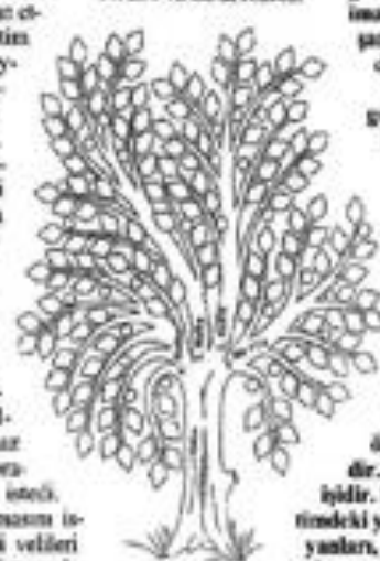
AYLIK NAMAZ AĞACI

karılmaktadır. Eğitimde bütün dikeye, inançlara eşit yaklaşılması gerekmektedir" dedi. İl Millî Eğitim Müdürlüğü, kaymakamın talimatı üzerine inceleme başlattı. Soruşturma açılıp açılmayacağı ise incelemenin ardından belirlenecek.